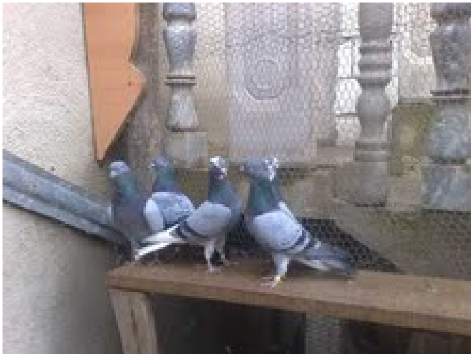
H. Shannon – golubovi

Belgabiovit postoji u bocama od 250, 500 i 1000 ml.